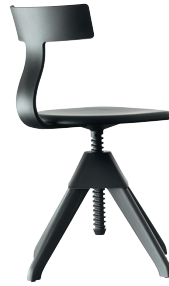
Seat + Frame: Beech painted Black Back + Joint: Black 1754 C